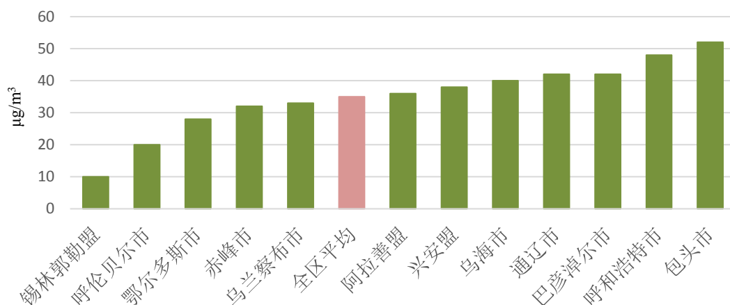
图2 12盟市细颗粒物 (PM2.5) 浓度情况